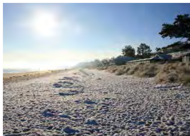
Weit und frei liegt der Strand wie hier in Scharbeutz vor einem, bei einem langen Spaziergang fühlt sich alles ein bisschen leichter an.

nen unterhaltsamen, humorigen Impro-Theaterbesuch der besonderen Art. Eine Fackellänge lang dauert der launige Strandspaziergang, bei dem die Teilnehmer zu Regisseuren werden. Denn mittels ihrer Hinweise und Stichworte entsteht während der Wanderung ein spontan improvisiertes Theaterstück. Karten gibt es inklusive Fackel und Punsch für 15 Euro im Online-