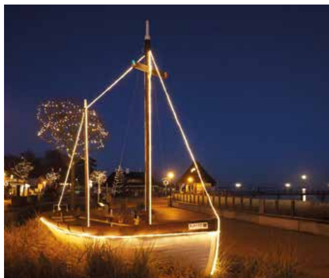
Winterlicher Lichterzauber an der Lübecker Bucht.

Beim „Wandertheater am Strand“ nimmt das Duo Claas und Hein seine Gäste mit auf ei-