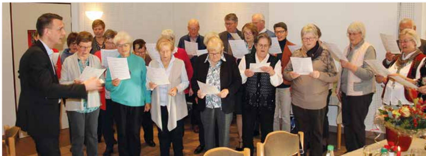
Die Chorgemeinschaft sang den Geehrten ein Ständchen.