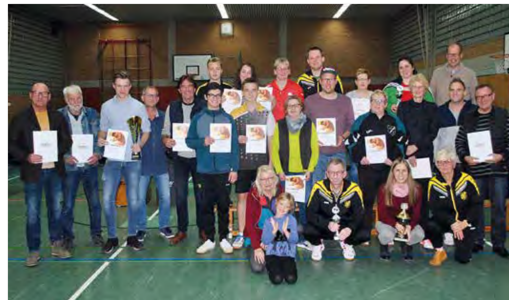
Gruppenbild der Teilnehmer im Seniorenbereich.